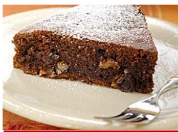
米粉のガトーショコラ