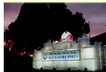
ブレオブジェ (舞鶴市役所前)

来年10月末には「第26回国民文化祭京都2011」の「ひかりのオブジェ」として、赤レンガ倉庫の前に市民の方たちが持ち寄った16,000個ものペットボトルを利用して作られる、高さ10mもある素敵なお城が披露される。